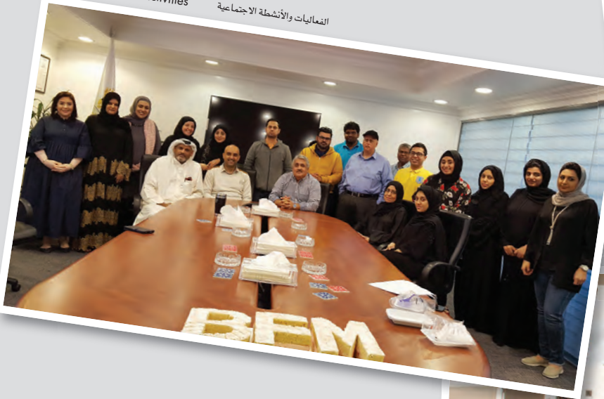
الفعاليات والأنشطة الاجتماعية