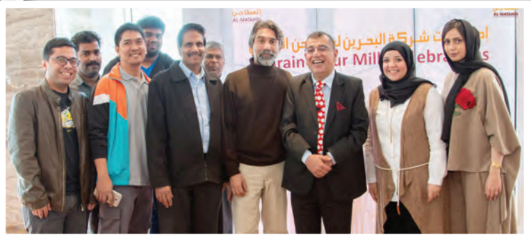
الفعاليات والأنشطة الاجتماعية