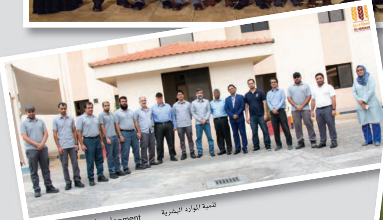
تنمية الموارد البشرية