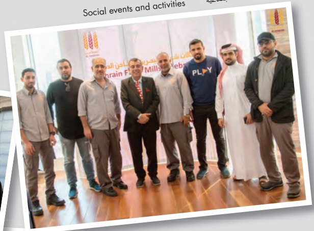
الفعاليات والأنشطة الاجتماعية