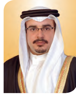
صاحب السمو الملكي الأمير سلمان بن حمد آل خليفة ولي العهد الأمين نائب القائد الأعلى النائب الأول لرئيس الوزراء مملكة البحرين