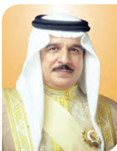
His Majesty King Hamad bin Isa Al Khalifa King of the Kingdom of Bahrain