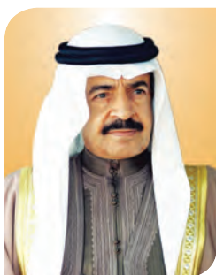
His Royal Highness Prince Khalifa bin Salman Al Khalifa The Prime Minister of the Kingdom of Bahrain