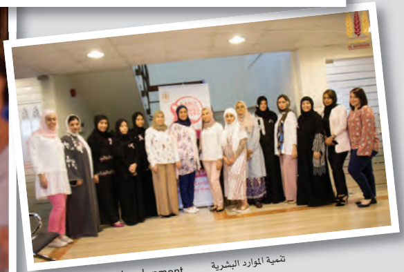
Human resource development