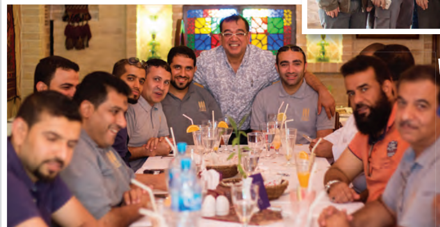
Social events and activities