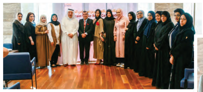
الفعاليات والأنشطة الاجتماعية