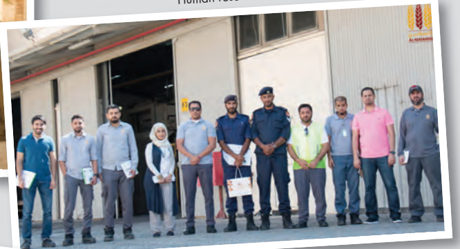
تنمية الموارد البشرية