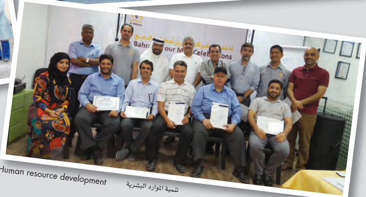
تنمية الموارد البشرية