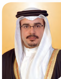
His Royal Highness Prince Salman bin Hamad Al Khalifa Crown Prince, Deputy Supreme Commander and First Deputy Prime Minister of the Kingdom of Bahrain